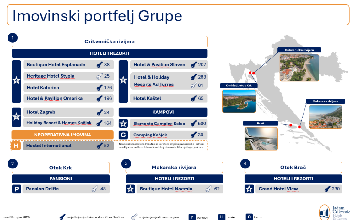
Slika 1 – Prikaz imovinskog portfelja Grupe na dan 30. rujna 2025. godine

Izdavatelj svoju osnovnu djelatnost obavlja u sljedećim smještajnim objektima: